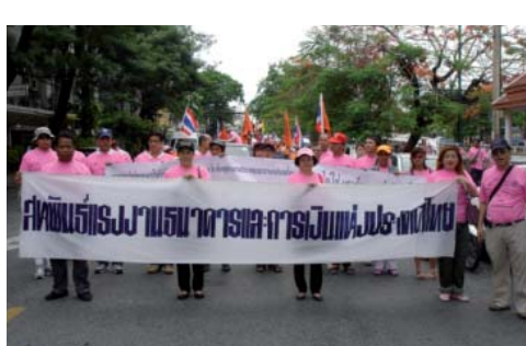
สหพันธ์แรงงานธนาคารฯ และสหภาพ แรงงานภาคธนาคาร ร่วมกิจกรรมวันแรงงาน 1 พฤษภาคม 2554