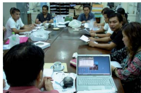
คณะกรรมการ สหพันธ์แรงงานธนาคารฯ กำลังประชุมเตรียมเรื่องประกาศ รพท. วันหยุดวันแรงงาน