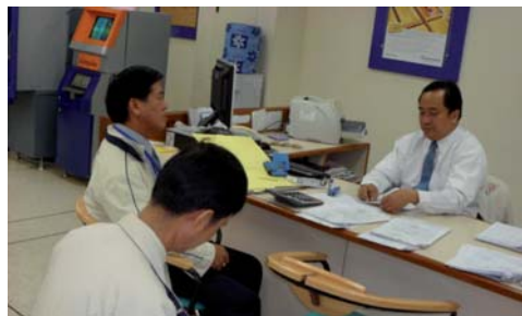
กรรมการสายที่ 2 กำลังพูดคุย และทักทายสมาชิกในสาขาภาคอีสาน