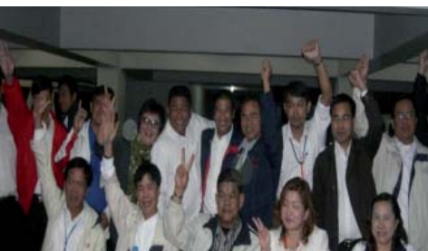
ผู้บริหารสาขาโคราช ต้อนรับกรรมการที่ไปเยี่ยมสาขา ทั้งสองสาย อย่างอบอุ่น และแต่งตั้ง คปจ. นครราชสีมา